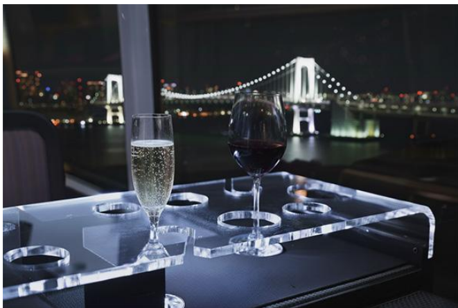
レインボーブリッジ