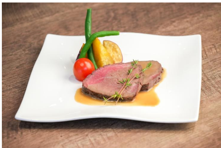
国産牛フィレ肉の香草ソース