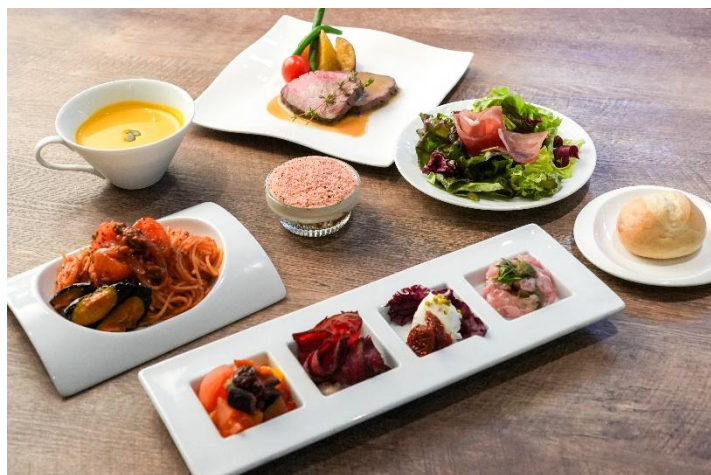
グルテンフリーイタリアン全体