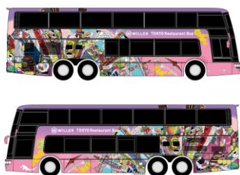
東京レストランバス外観