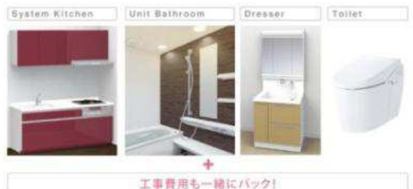
エルズパック (イメージ)