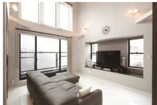
プレミアムパック (Urban Stylish イメージ)

都会的なインテリアで洗練された空間をご提案 上質な自然素材がやさしく手触りのいい空間を