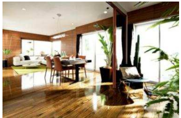
中古マンションのリフォーム後（イメージ）

※ 大京穴吹不動産によるリノベーションマンション販売件数と 中古マンション売買仲介件数の合計（全社）