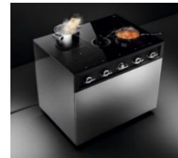
循環式 IH 調理ワゴン 「アリアシェフプロ」

※6 ご使用の際は、製品近辺に単相 200V 専用コンセント(定格 30A 以上)を設け単独で使用してください。他の器具と併用すると分岐コンセント部が異常発熱し発火する危険があります。コンセントの新設が必要な場合には電気工事業者へご相談ください。