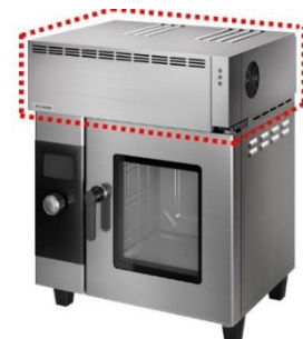
電気式スチームコンベクション オープン用蒸気回収装置 「スチームコレクター」

https://pro.fujioh.com/chubokankyo/products/steamcollector/