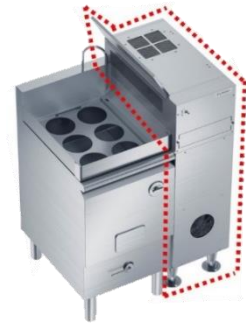
電気ゆで麺器用蒸気回収装置 「スチームコレクター」

製品詳細： https://pro.fujioh.com/chubokankyo/products/steamcollector-noodleboiler/