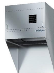
調理油煙回収ユニット 「オイルスマッシャー搭載 クッキングオイルコレクター(循環タイプ)」

製品詳細: https://pro.fujioh.com/chubokankyo/products/cookingoilcollector/