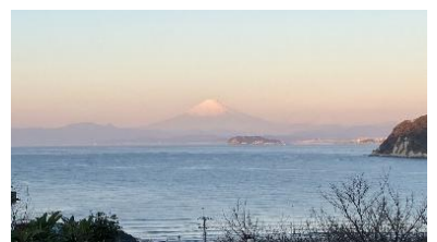
田浦梅の里（画像はイメージ）