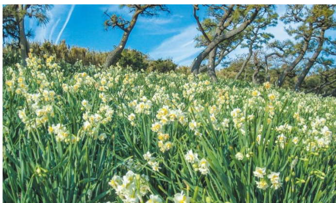
「神奈川県立城ヶ島公園の水仙」