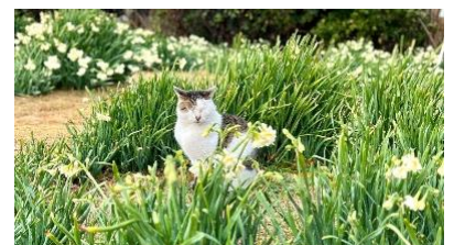
城ヶ島公園（画像はイメージ）