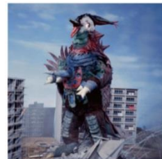
【ブラックピジョン】 初登場作品:『ウルトラマン A』(1972 年)