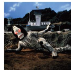
【ダダ】 初登場作品:『ウルトラマン』(1967 年)