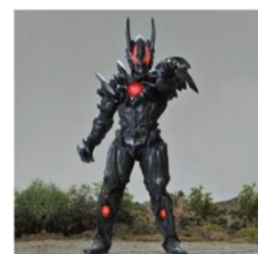
【ダークルギエル】 初登場作品:『ウルトラマンギンガ』(2013 年)