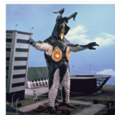
【ゼットン】 初登場作品:『ウルトラマン』(1967 年)