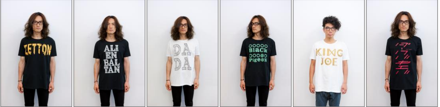
MODEL : 唐橋充、片桐仁(ラーメンズ)