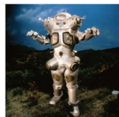
【キングジョー】 初登場作品:『ウルトラセブン』(1968 年)