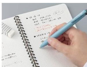
色分けして書きやすい

従来の多機能ペンの構造は、中芯にスプリングが巻きついていて、スリムにしようと中芯を中央に寄せると、スプリング同士が絡まるため、スリム化できませんでした。ボディをスリムにするため、スプリングを中芯の隣に配置する「サイドスプリング機構」を開発し、中芯を中央に寄せる配置を可能にしました。従来と同じ中芯を使用しながら、軸径の 7%スリム化と 8%軽量化(いずれも従来品対比)を実現しました。この機構は 2024 年に発売した「サラサクリップ 3C」で初めて搭載し、今回シャープを入れた多機能ペンでも部品などを見直し開発しました。