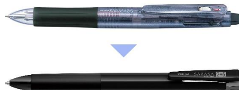
(上) 従来品 (下) 新商品 サイドスプリング機構でスリム化

*** この商品に関する報道関係の方のお問い合わせ先 *** ゼブラホールディングス株式会社 プロダクト&マーケティング部 PR チーム: 畑中・鈴木 TEL: 050-1706-0335 e-mail: yhatanaka@zebra.co.jp / ysuzuki@zebra.co.jp *** この商品に関する消費者の方のお問い合わせ先 *** ゼブラ株式会社 お客様相談室 TEL: 0120-555335(平日 9 時～17 時) https://www.zebra.co.jp/