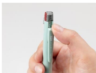
押しやすいシャープノック