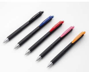
▲定番商品「サラサナノ」