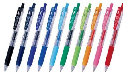
▲定番商品「サラサクリップ」

さらさらとした軽い書き心地と、濃くあざやかな発色が特長のジェルボールペンです。2003 年の発売以降、インクがなくなるまで書ききれる品質を 20 年以上追求しています。同じサラサシリーズでは、社会人を対象にした 3 色ジェルボールペンの「サラサクリップ 3C」やビンテージカラーで高級感溢れるジェルボールペン「サラサグランド」、極細タイプでもさらさら書ける「サラサナノ」など、時代のニーズに合わせて商品のバリエーションを増やしています。