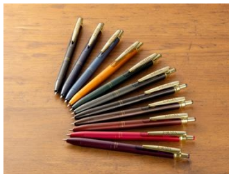
▲定番商品「サラサグランド」