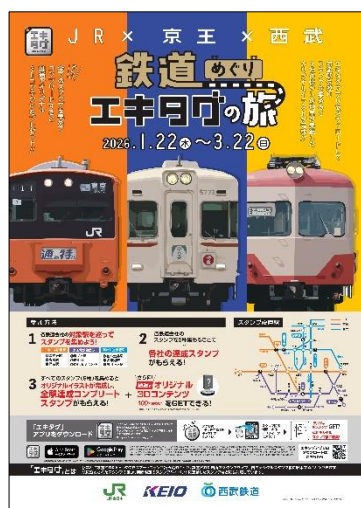
《ポスターイメージ》