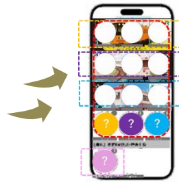
スタンプ台紙イメージ

さらに！／すべてのスタンプ(9種)を集めると抽選でオリジナル3Dコンテンツが当たります！(※100名様限定)