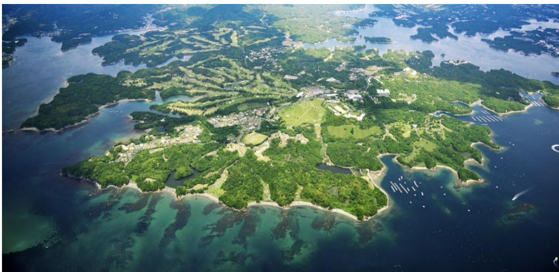
NEMU HOTEL & RESORT 全景