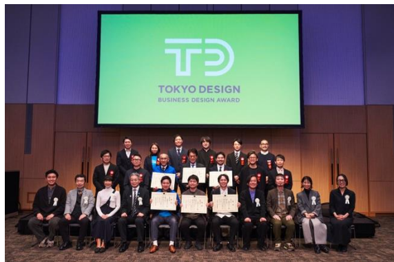
2024年度提案最終審査会の様子

テーマ賞受賞後、企業とデザイナーは審査委員・事務局の支援の下、ビジネス実現化に向けて検討を進めます。