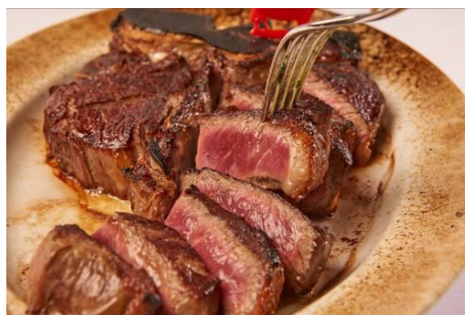
プライムステーキ（2 名様用）