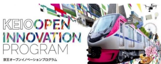
《京王オープンイノベーションプログラムメインビジュアル》

公式サイト： https://www.keio.co.jp/railroad/keio-open-innovation/