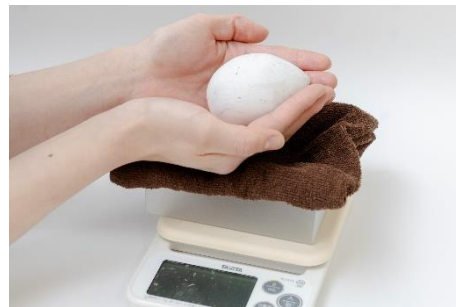
手に取り重さを体験できる模型（イメージ）

生まれたときから大きかった「うしわか（牛若通り）」、飼育スタッフの介助なしでは成長できないほど小さかった「ぽん（先斗町通り）」、標準的な成長をしてきた「せん（千本通り）」の3羽について、それぞれペンギンの卵、0日齢のヒナ、34日齢のヒナの重さを体感できる体験型展示を行います。手に取り、その重みを感じることで、それぞれの成長を体感することができます。さらに、3羽の現在の大きさを再現した等身大ペンギンパネルも登場。ご来館の記念にペンギンたちとの撮影をお楽しみください。