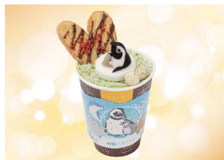
ぶかぶかペンギン親子のほうじ茶ラテ