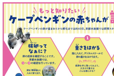
展示パネル（イメージ）

京都水族館では、ペンギンの卵が産まれると、ふ化の直前まで親鳥に代わり飼育スタッフが育てます。ふ化までの約40日間、毎日卵の成長を確認し、その記録を付けています。日々の成長確認では飼育スタッフがどのように工夫をしながら、どのような作業を行っているのかをまとめたパネル展示を行います。