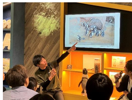
特別イベント (イメージ)

※ 応募多数の場合は抽選になります。当選された方には①2026年1月17日(土) ②2026年2月7日(土) にメールでご連絡します。