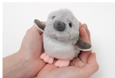
ぬいぐるみ ベビーペンギン