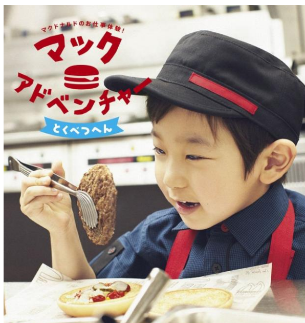
【「マックアドベンチャー とくべつへん」イメージ】

これからもマクドナルドでは、お子様の健全な成長に貢献し、ご家族の“ハッピーな笑顔があふれるお食事の場”を提供してまいります。