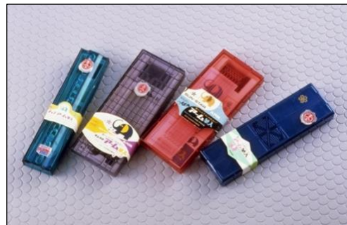
▲1960 年代当時の商品（100～350 円程度）

『アーム筆入』は、透明度が高く、耐衝撃性に優れたプラスチック素材「ポリカーボネート」を採用した筆入です。ポリカーボネートは、信号機のレンズや飛行機の窓など、高い耐久性と安全性が求められる場面で使用されている素材として知られています。