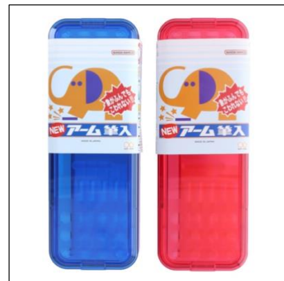
▲「NEW アーム筆入」880 円（税込）

『アーム筆入』は、発売から改良を重ねながらも、現在も「NEW アーム筆入」として製造・販売を継続しており、2025 年に発売 60 周年を迎えたロングセラー商品です。時代とともに学習環境や子どもたちの使い方が変化する中でも、「丈夫で、安全に使える筆入」という開発当初からの思想は、変わることなく受け継がれてきました。