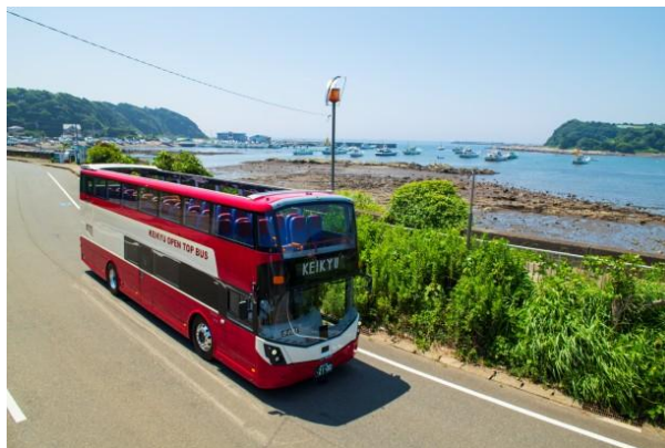
KEIKYU OPEN TOP BUS MIURA