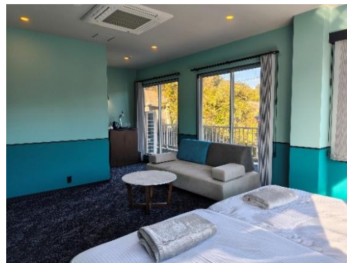
TAP INN MIURA イメージ