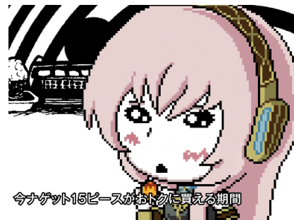
※第一弾コラボ動画イメージ画像

YouTube での視聴回数が 1,200 万回を超える人気楽曲「ダブルリアット」(アゴアニキ feat. 巡音ルカ)と、チキンマックナゲットのコラボ企画「ダブルクナゲット」第二弾を、公式 X にて公開いたします。本企画では「ダブルリアット」の作曲者であるアゴアニキさまに監修していただき、巡音ルカが同曲の替え歌を披露するオリジナルバージョンのコラボ動画を展開。先日公開した第一弾では、公開後に「ダブルリアット」や「ナゲット」といった関連ワードが SNS でトレンド入りするなど、大きな反響を呼びました。そしてこのたび、第一弾に続く第二弾として、同じくオリジナルバージョンによる新たなコラボ動画を公開いたしますので、ぜひご期待ください。