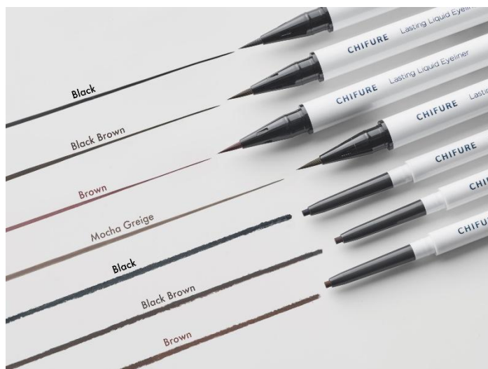
『ちふれ ラスティング リキッド アイライナー』 『ちふれ クリーミー ジェル アイライナー』