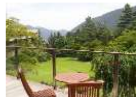
箱根ホテル小涌園 HAKONE HOTEL KOWAKIEN

名 称: 箱根ホテル小涌園 温泉名: 小涌谷供給温泉 客 室: 全 224 室 (露天風呂付客室 3 室) 住 所: 〒250-0407 神奈川県足柄下郡箱根町二ノ平 1297 TEL.0460-82-4111 FAX.0460-82-4123 URL: http://www.hakoneho-kowakien.com/