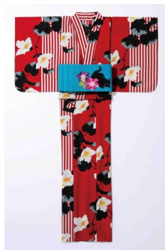
③<撫松庵> ゆかた 37,800円 半幅帯 30,240円