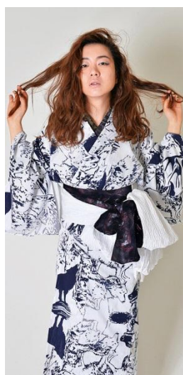
② <Rumi Rock> ゆかた 39,960円 半幅帯 15,120円