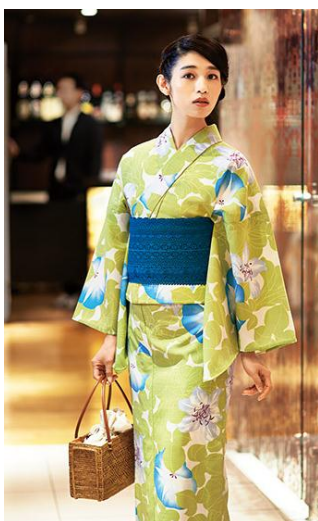
① <撫松庵> ゆかた 37,800円 半幅帯 14,040円