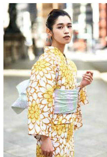
<趣味小町> ゆかた 41,040円 兵児帯 10,260円