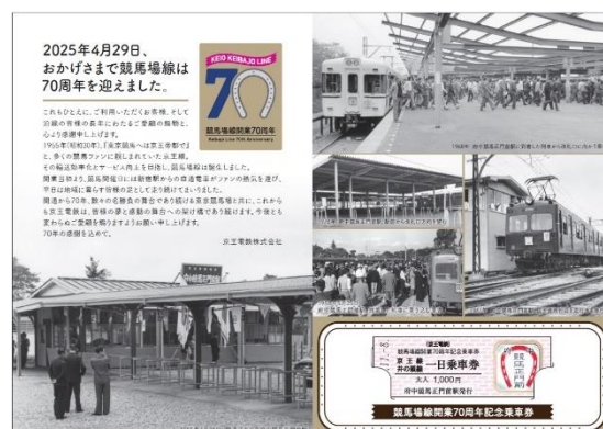
＜競馬場線開業70周年 記念乗車券(台紙表面イメージ)＞