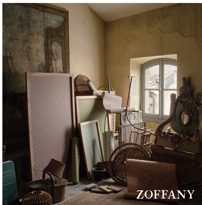
▲ 壁紙：『ENDPAPERS（エンドペーパーズ）』 ¥43,120 ～ / 本（52-68.6cm 巾 × 10.05m）不燃（1-3）

春の新作とのコーディネートも楽しめるゾファニーの新作は tomita TOKYO と大阪ショールームにてご覧いただけます。