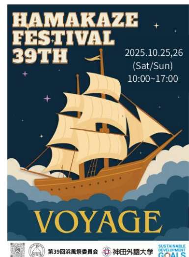
▲「第39回浜風祭」ポスター