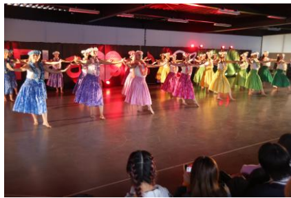
▲昨年のサークル出演の様子