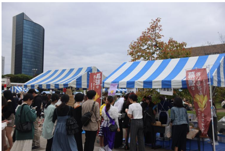
▲過去の開催の様子

【特設サイト】 https://www.kandagaigo.ac.jp/kuis/main/campuslife/hamasai/