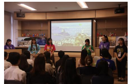
▲昨年のゼミ発表の様子