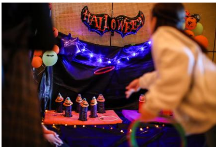
▲ハロウィン縁日イメージ

本学のゼミが活動報告や、研究結果の発表を行います。それぞれのゼミらしい、努力の成果をご覧ください。