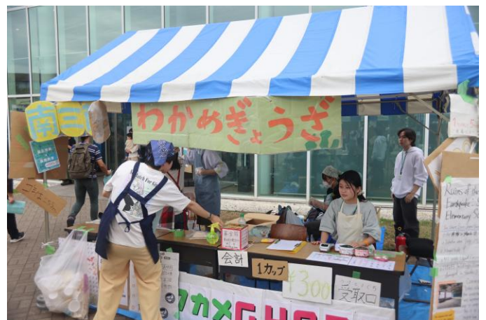
▲昨年のテント販売の様子2