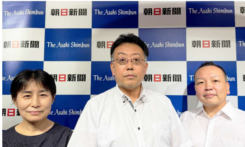
▲CTM2.0導入プロジェクトを進める朝日新聞社と朝日新聞総合サービスのみなさま

WHI Holdingsは、今後も統合人事システム「COMPANY®」の提供を通じて日本企業の人的資本マネジメントを統合的に支援し、はたらくすべての人が真価を発揮できる社会の実現に努めてまいります。