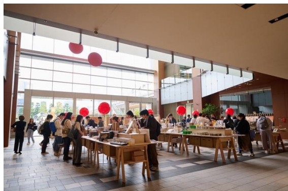
2024年のGOOD DESIGN STORE TOKYO by NOHARA POP UPストア

日用品や文具、インテリアやアパレル商品など、今年度のグッドデザイン賞受賞商品を多数含む約250種の受賞アイテムを販売予定です。最新の受賞対象も、いち早く購入できます。