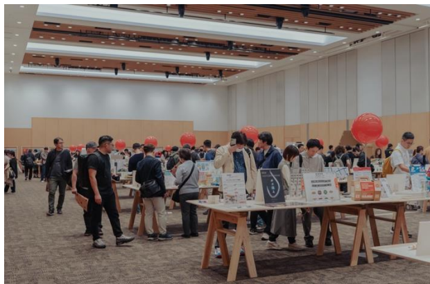
GOOD DESIGN EXHIBITION 2024開催時の様子