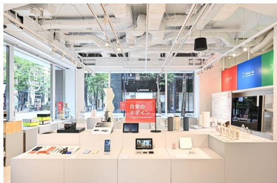
2024年の「私の選んだ一品」展示会場

会期：第1期「ときめき」10月15日（水）～10月27日（月） [13日間] 11:00～20:00 ※ 第2期「おどろき・気づき」10月29日（水）～11月9日（火） [12日間] 11:00～20:00 ※ 第3期「わくわく」11月11日（火）～11月23日（日） [13日間] 11:00～20:00 ※ 入場無料・事前予約不要。各期の最終日は17:00終了。