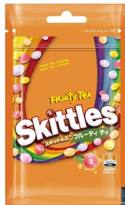
「スキットルズ® フルーティ ティ」