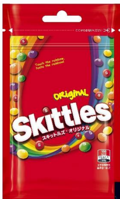
「スキットルズ® オリジナル」