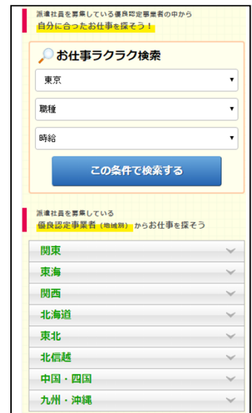
▲認定企業からの案件検索可能