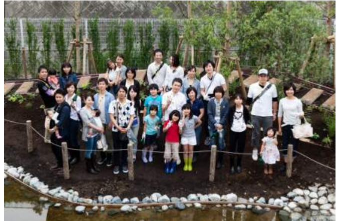
参加者の皆様で記念撮影