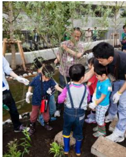
中木の植樹の様子