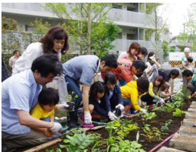
植樹をする入居予定者たち

普段は土に触れる機会があまり無い参加者の方たちも、スタッフのアドバイスを受けながら植樹を楽しまれていました。また、入居予定者同士で交流する場面も見受けられました。