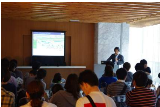
生態系配慮型植栽維持管理体制のご説明