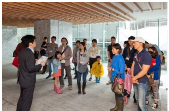
共用施設のご案内