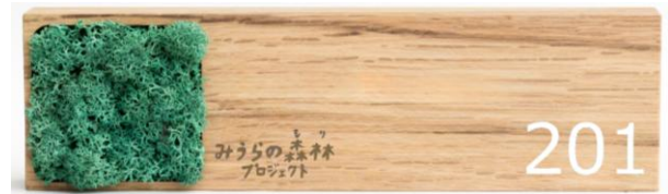
部屋番号プレートイメージ

社有林を活用した「みうらの森林（もり）プロジェクト」の一環として、森林管理で発生した間伐材を活用した各部屋の「部屋番号プレート」を採用します。