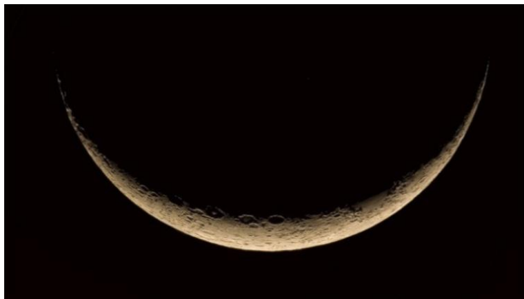
「宇宙をうけとめる」