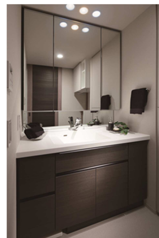
Ki-Le-i DRESSER (キレイドレッサー)

『Nature & Gentle (ネイチャー&ジェントル)』では、“自然素材の優しい手触り感”をキーワードに、自然素材の風合いの良さを肌で感じる事が出来る色彩素材を使用することで、柔らかく温かみのある住まいを演出しました。