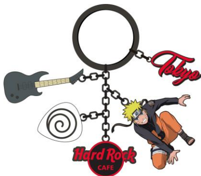
「NARUTO-ナルト- 疾風伝」×HRC Keychain