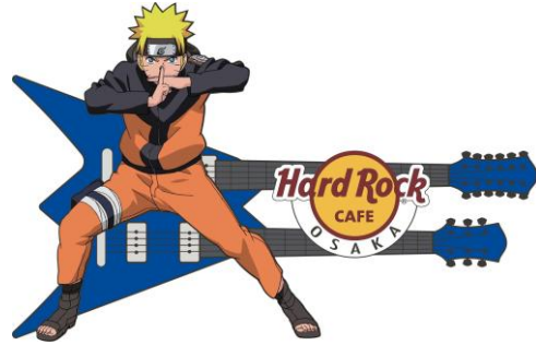
ユニバーサル・シティウォーク大阪店限定