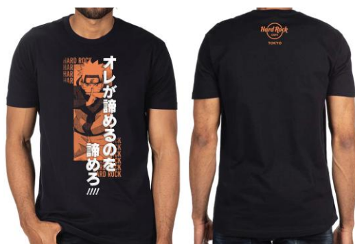
「NARUTO-ナルト- 疾風伝」×HRC Unisex Tee Black