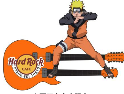
上野駅東京店限定