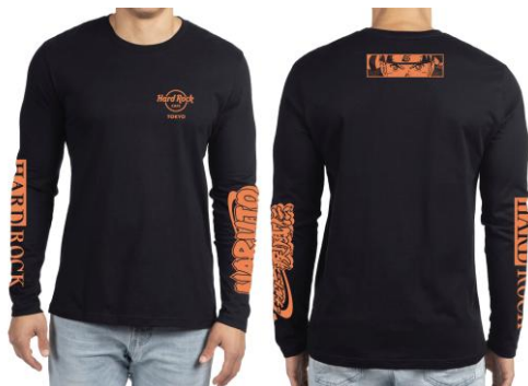
「NARUTO-ナルト- 疾風伝」×HRC Unisex Long Sleeve Tee Black