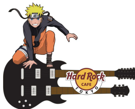
「NARUTO-ナルト- 疾風伝」×HRC Magnet