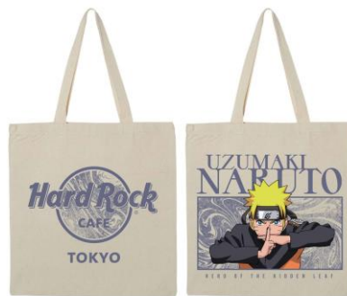
「NARUTO-ナルト- 疾風伝」×HRC Tote