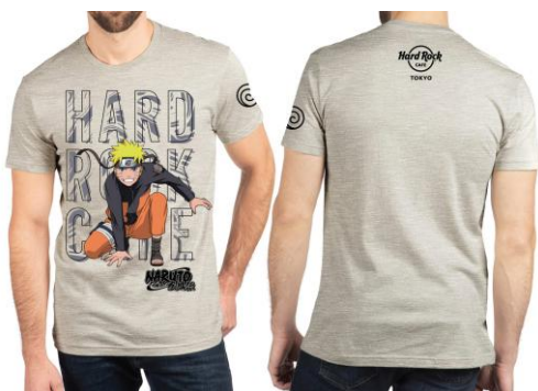
「NARUTO-ナルト- 疾風伝」×HRC Unisex Tee Oatmeal