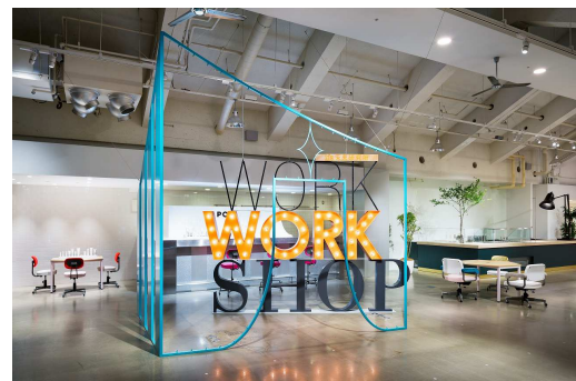
会場(ifs 未来研究所 未来研サロン WORK WORK SHOP)イメージ

◇春学期の講座のお申し込みは、「CLASS ROOM」のオフィシャルサイト ( http://www.lumine.ne.jp/classroom/ )で受け付けています。