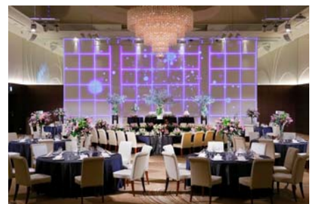
メインバンケットホール「鳳翔」

メインバンケットホールの名前の由来である「鳳凰」が飛び立つイメージをコンセプトに、「鳳凰」の羽をモチーフにした勢いが感じられるデザインを壁面とカーペットに採用しながらも、会津の伝統と格式を感じられる空間へと刷新。また、会津エリアで初の3Dプロジェクションマッピングなどの新照明・映像システムを導入し、バンケットルームの壁面に映像を投影することで、ダイナミックな動きのある演出が可能になりました。