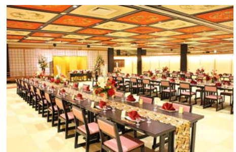
和式大宴会場「芙蓉」

「芙蓉」の花言葉である「繊細な美」「しとやかさ」を表現する色使いと、「芙蓉」の花を想起させる「親しみ・優雅さ・華やかさ」を表すデザインをあしらひ、床面を総琉球畳に変更しました。ご宴会だけでなく、和婚にもご利用いただける趣ある空間に改装しました。