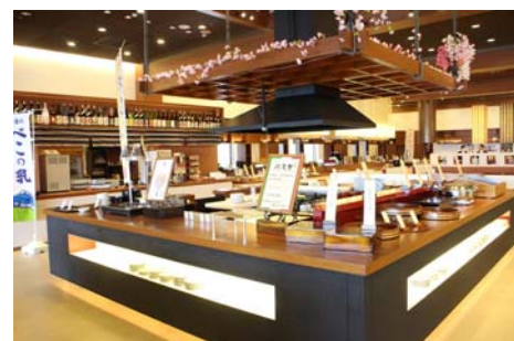
バイキングレストラン「あがらんしょ」

中宴会場および客室 39 室を中心に、本館の全館リニューアルを行いました。清潔感あふれる空間を提供し、より快適にお過ごしいただけます。