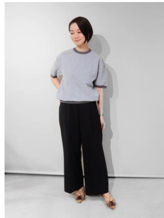
レディース着用イメージ（ホワイト）