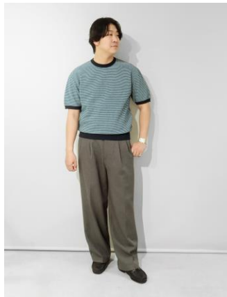
メンズ着用イメージ（グリーン）