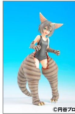
フィギュア 「ゴモラ」 9,000 円(税込)