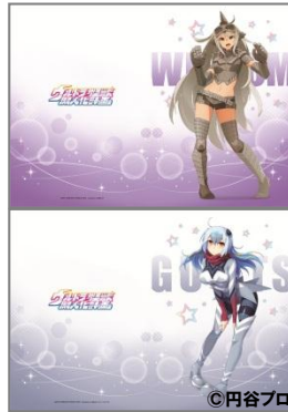
クリアファイル (全 6 種) 350 円(税込)