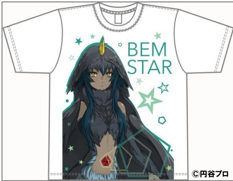
ベムスター 全面プリント T シャツ 4,500 円(税込)

『ウルトラ怪獣擬人化計画』の人気キャラクター「ベムスター」をモチーフにした全面プリント T シャツを「AnimeJapan 2015」にて先行発売。その他、「ゴモラ」のフィギュアやクリアファイル、T シャツ、タペストリー、イラストブックなどを販売いたします。