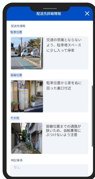
スマートフォンで確認可能な配送先情報画面

また、配送先情報の確認もできるようになりました。LP ガスボンベの設置位置や配送トラックの駐車位置など文字だけでは伝わりづらい情報を配送先で確認することができます。これにより、配送員は初めて行く配送先でも作業をすることができるので、配送業務の属人化解消に貢献します。