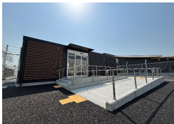
ラウンジ/事務所棟