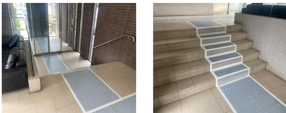
リユース可能な養生シート使用例

株式会社大京穴吹不動産（本社：東京都渋谷区、社長：森本 秀樹）は、このたび、マンションのリフォーム工事で使用する養生シートを、リユース可能な製品に切り替えますのでお知らせします。首都圏の工事現場を中心に順次導入します。