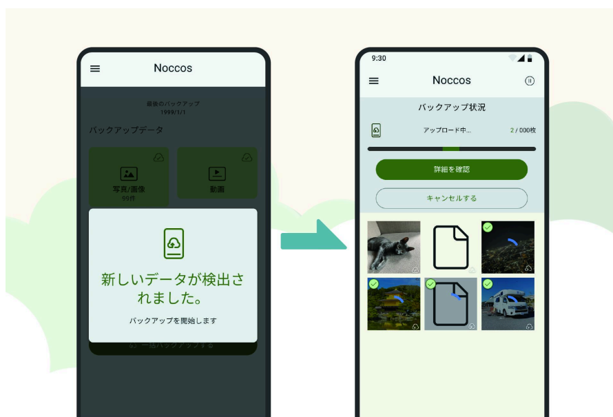
容量の多い大量の写真や動画データも高速バックアップ・復元が可能 また、おまかせバックアップ機能も搭載