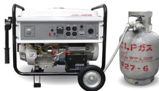
ハイブリッド式 非常用小型発電機 「HYB5500L」