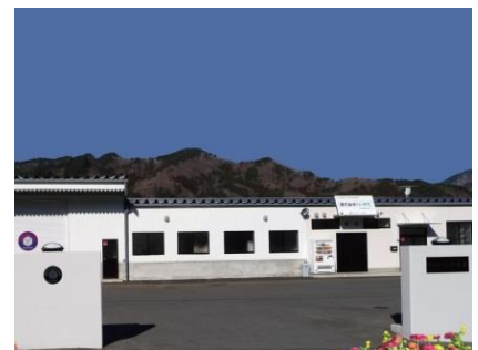
現在の山岸産業本社兼工場