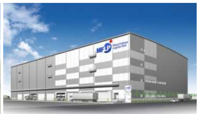
「三井不動産ロジスティクスパーク平塚」イメージ