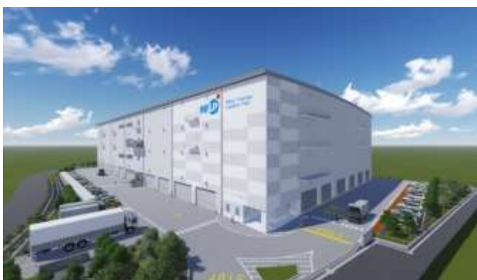
「三井不動産ロジスティクスパーク柏」イメージ