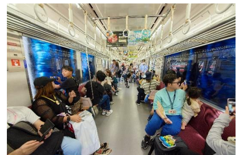
洗車体験※イメージ