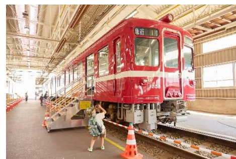
旧 1000 形車両展示※イメージ