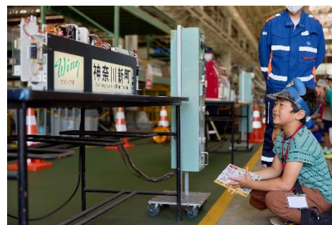
側面表示器操作体験※イメージ