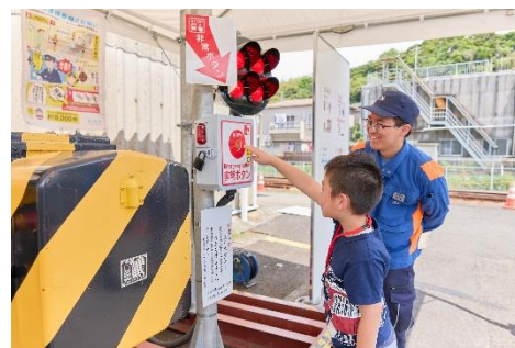
踏切非常ボタン操作体験