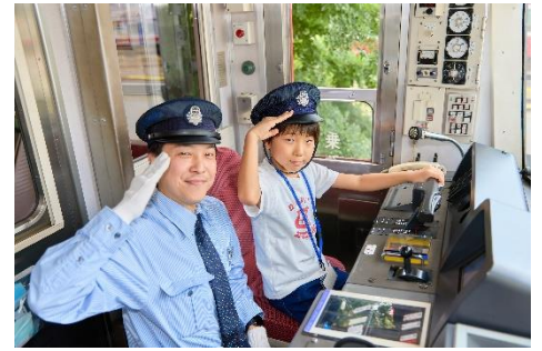
運転台撮影※イメージ