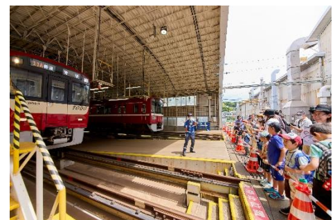
正面表示器実演※イメージ