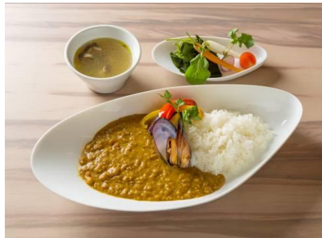
フィッシャーマンカレー