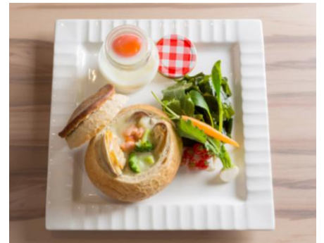
三陸シーフードチャウダー