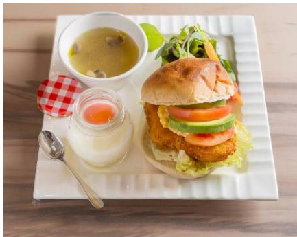
三陸メカジキバーガー