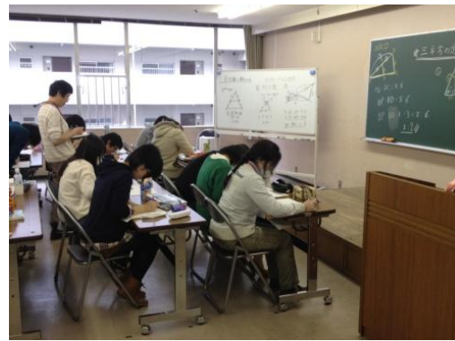
現地に講師を派遣しての学習支援の様子