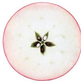
※林檎の花と果実のイメージカット