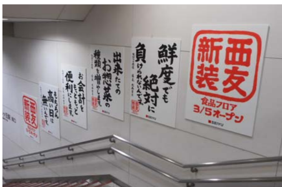
西武池袋線ひばりヶ丘駅階段

また、「鮮度でも絶対に負けられないんです。」「もちろん高い日はないんです。」など、お客様の期待に応える店長の想いをこめたインパクトの強い筆文字のメッセージポスターや横断幕を、店頭や店内はもちろん、駅構内や店舗近隣に大きく掲出し、新装オープンの告知とともに鮮度や価格の安さ、利便性をアピールします。