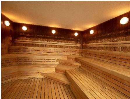
スタジアムサウナ