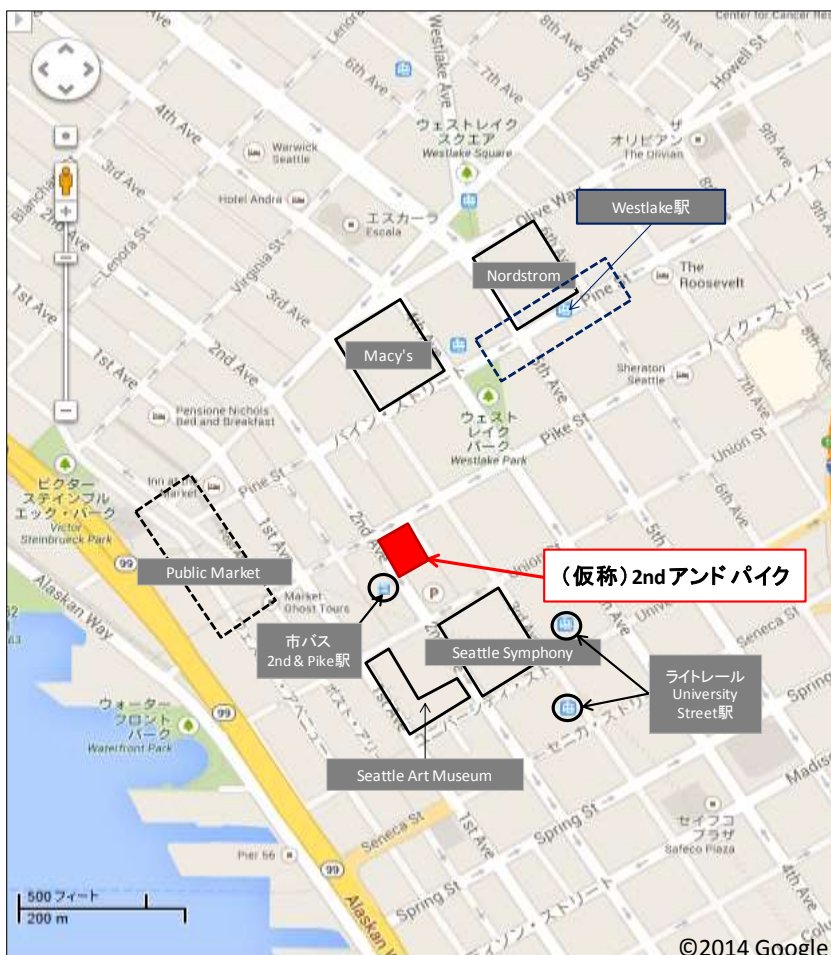
広域図内の赤枠点線部分の詳細図