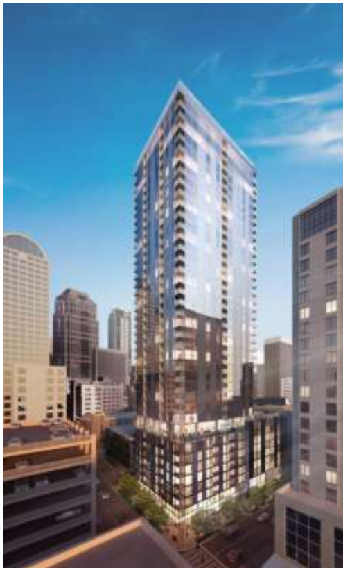
(仮称)2nd アンド パイク イメージパース