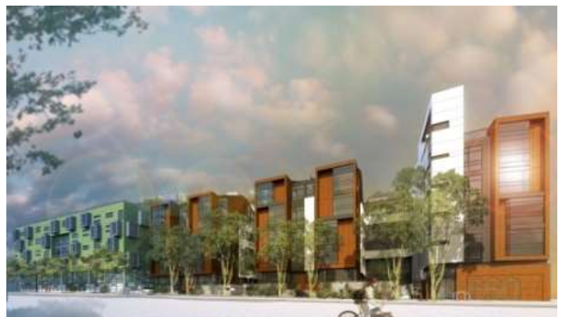
(仮称)650 インディアナ イメージパース