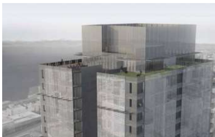
最上階ルーフテラス イメージパース

共同事業者の「Urban Visions」は、シアトルに本社を構え、市内中心部にてオフィスビルおよび住宅の開発からリノベーションまでを幅広く手掛けるデベロッパーで、竣工は2017年秋を予定しています。