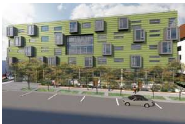
南棟イメージパース