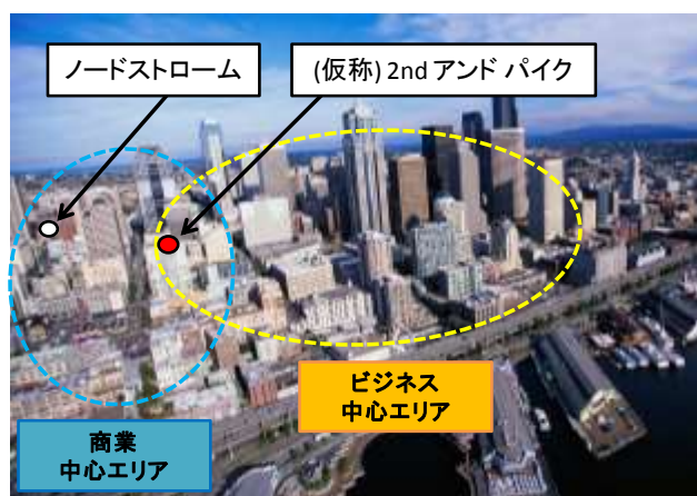
シアトル眺望写真