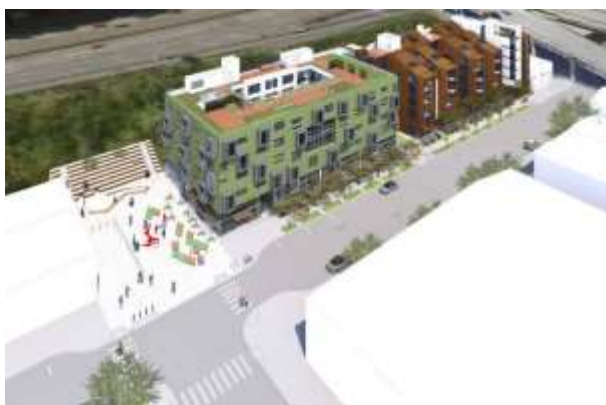
俯瞰イメージパース

共同事業者の「Build Inc.」は、サンフランシスコに本社を構え、ドッグパッチ地区を含め市内で豊富な開発実績のあるデベロッパーで、竣工は2016年夏を予定しています。