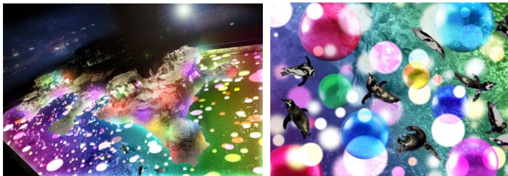
幅24メートルの日本最大級のペンギンプールを5,000のキャンディカラーの光で満たす プロジェクションマッピング『Penguin Candy』

さらに、1日4回開催する「Penguin Candy」は、映像と音楽を使用した特別なコンテンツです。映像の終盤では5,000のポップでカラフルなキャンディを模した光の演出でペンギンプールを満たします。ペンギンたちの好奇心を刺激し、お客さまにも楽しんでいただける10分間のプログラムです。