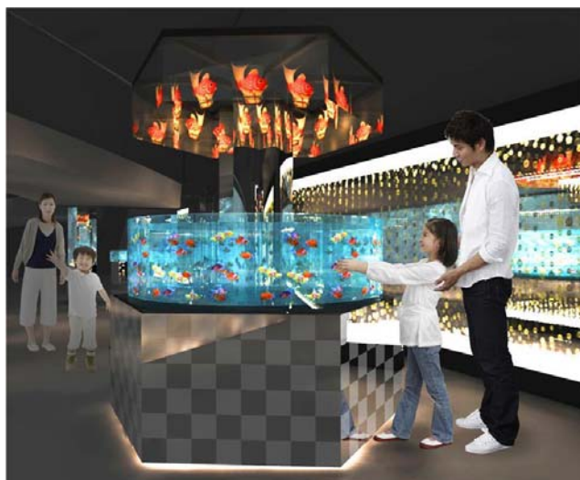
江戸時代より人々に愛されている金魚などの約2,000匹の水生生物を展示する 『Edorium』

展示名称 : 『Edorium(エドリウム)』 展示期間 : 2015年4月25日(土) オープン 展示時間 : 終日展示 展示生物 : 金魚(ランチュウ、エドニシキ、ワキン) (予定) アナゴ、ナマズ、ドジョウ 展示内容 : 2メートルの円柱水槽で展示するワキンなど約2,000匹の水生生物を展示する新ゾーンです。「雅」と「粋」をテーマとした二つの異なるエリアで構成するこのゾーンは、懐かしくも新しい新しい水族館での体験をご提供します。日本が誇る江戸文化を水族館として表現した、新感覚のゾーンです。