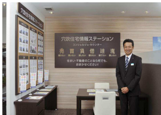
新サービス『住宅情報ステーション』 コンシェルジュ・カウンター