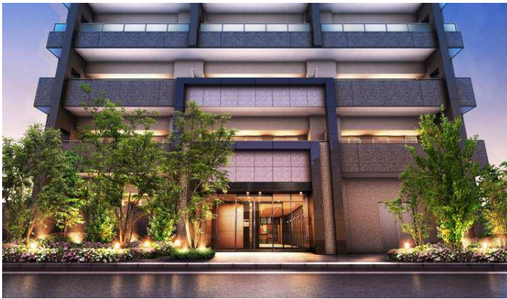
格調高いエントランスファサード

歴史ある街並み邸宅の美意識と誇りを描き、圧倒的な存在感を放つエントランスアプローチ。照国神社の鳥居をイメージさせる堂々とした構えのファサードは、質感豊かな石材やタイルを配し、格調高い表情をデザインします。また家族を迎え入れるエントランスホールには薩摩切子でデザインされたアクセント照明など、伝統と芸術が融合する迎賓の空間を追求しました。