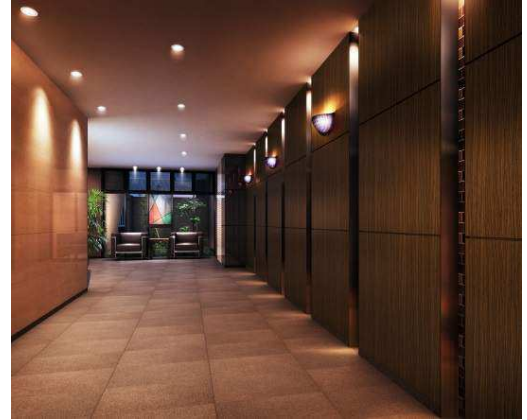
上質のエントランスホール