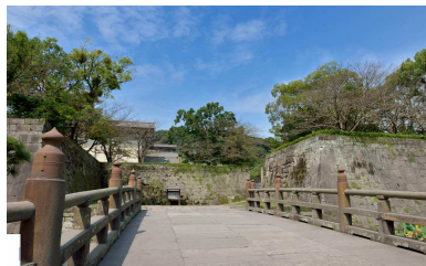
鹿児島県歴史資料センター黎明館 徒歩10分(約790m)