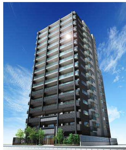
完成予想外観パース