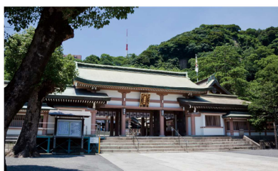
照国神社 徒歩4分(約280m)

「サーパス照国表参道」が誕生する照国町周辺には、照国神社や鹿児島県歴史資料センター黎明館(鶴丸城跡)、鹿児島市立美術館など歴史・文化の施設が揃い、現代の洗練された都市づくりの中に築かれてきた歴史が息づいています。