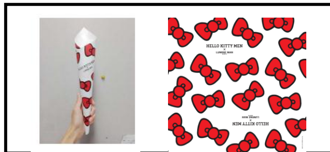
＜クレープラッピング紙＞ (C)'04,15 SANRIO