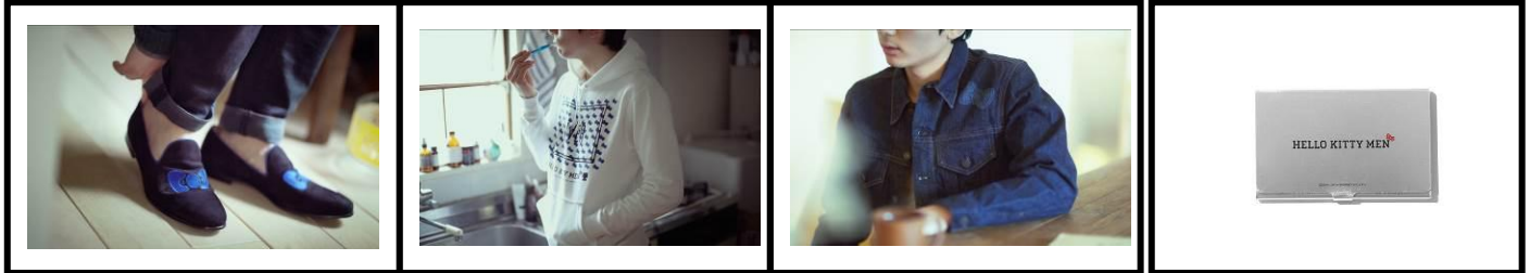
＜アンライン バイ アルフレッド バニスター＞ オペラシューズ ¥30,240(税込)